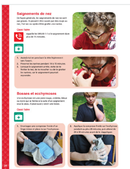
Exemples de pages